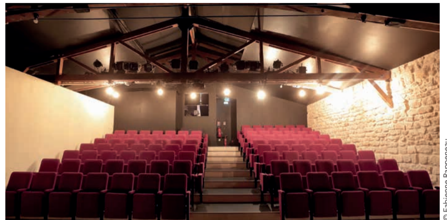
La nouvelle salle du Funambule, refaite il y a deux ans

S i, à l'origine, le café-théâtre désigne un café accueillant des spectacles, il renvoie aujourd'hui à un type de théâtre privilégiant la proximité avec le public. C'est là que se produisent des spectacles d'humour, comédies à petit budget ou one-man-shows, dans des conditions initialement précaires mais qui s'améliorent avec le temps, à l'image du nouveau Funambule, entièrement refait il y a deux ans. On n'évoquera donc ni les théâtres subventionnés ni ces cabarets que Montmartre a vu éclore depuis la fin du 19 e siècle avec le Moulin rouge et consorts, tout comme les diners spectacles de type Michou, en portrait dans le précédent numéro de 18 Les nouvelles . Petit tour d'horizon des lieux où se produit l'humour d'aujourd'hui, dans le 18 e arrondissement. Cela se passe à Montmartre, bien sûr, mais aussi de part et d'autre de la butte, de la place Blanche à la porte des Poissonniers.